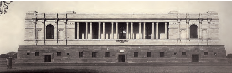
चित्रम् ४ – “भारतीय-राष्ट्रीय-अभिलेखागारम्” १९२०तमे दशके निर्मितम् ।

अभिलेखान् कुशलसुलेखकाः लिखन्ति स्म । सुलेखकाः (खुशानवीसी) ते जनाः भवन्ति स्म ये व्यवस्थितप्रकारेण सुलेखेन च तथ्यानि लिखन्ति । एकोनविंशतिशताब्द्याः