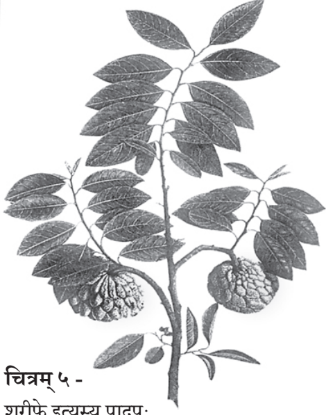
चित्रम् ५ -