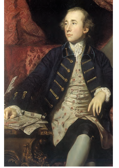
चित्रम् ३ – वॉरेनहेस्टिंग्सः १७७३तमवर्षे भारतस्य प्रथमराष्ट्राध्यक्षः जातः ।

मिलवर्यः अनुभवतिस्मयत् सर्वे एशिया-भूभागीयाः समाजाः सभ्यतायाः विषये यूरोपस्य अपेक्षया पृष्ठे वर्तन्ते । अत्रत्येतिहासस्य विषये तस्य मिलवर्यस्य ज्ञानम् एतादृशम् आसीत् यत् भारते आङ्ग्लीयानाम् आगमनात् पूर्वम् अत्र हिन्दु-मुस्लिम-शासकैः एव शासनं क्रियते स्म । अत्र सर्वत्र धार्मिकविद्वेषस्य जातिगतबन्धनानां कुरीतीनाम् अन्धविश्वासानां च एव प्रसारः आसीत् ।